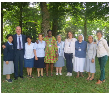
Communauté de sainte Thérèse de l'Enfant Jésus