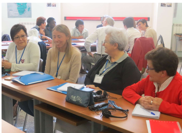
Soeurs et collaborateurs dans la Salle du Chapitre

et le développement du mouvement « Laïcs Hospitaliers » dans tous les pays dans lesquels l'Œuvre Hospitalière est présente.