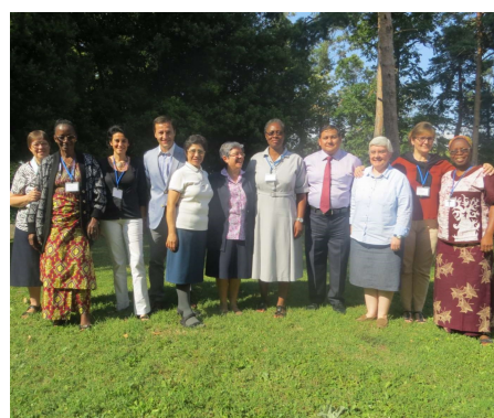
Communauté de saint Camille de Lellis