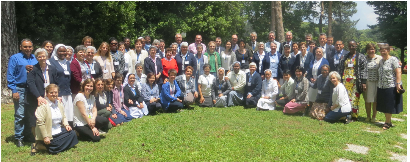
Les sœurs, collaborateurs et laïcs hospitaliers participant au XXI e Chapitre général

Du 8 au 30 juin 2018, au Centre de Spiritualité du Sacré-Cœur-de-Jésus, à Rocca di Papa (Rome, Italie), a eu lieu le XXI e Chapitre général de la Congrégation des Sœurs Hospitalières du Sacré-Cœur de Jésus. Cet événement de grande importance institutionnelle a rassemblé pendant une semaine 39 sœurs ainsi que 20 collaborateurs et 6 laïcs hospitaliers, représentant l'universalité de la Congrégation et le caractère ecclésial du charisme hospitalier. Le slogan choisi pour ce Chapitre a été « Pratiquiez l'Hospitalité » (Rm 12, 13).