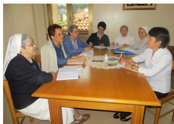
Étapes du XXI e Chapitre général