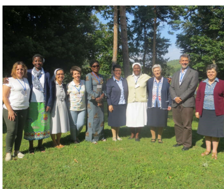
Communauté de l'Archange saint Raphaël