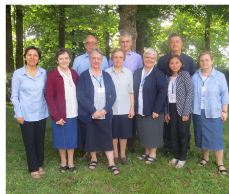
Communauté de saint Joseph