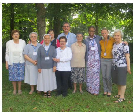
Communauté de saint Augustin