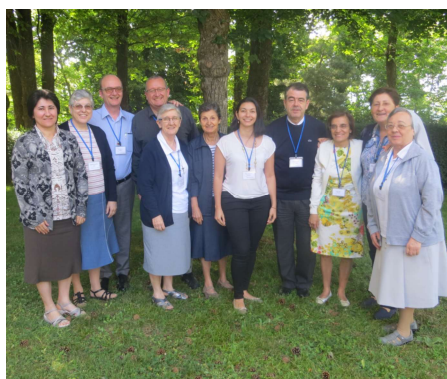
Communauté de sainte Élisabeth de Hongrie